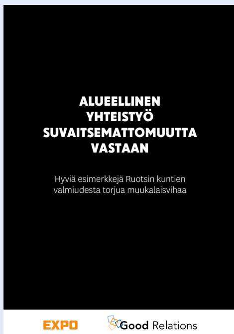
Publikationen Lokal samverkan mot intolerans

I alla kommuner som publikationen presenterar (Kungälv, Göteborg, Botkyrka, Malmö och Söderköping) har framgången krävt ett fungerande samarbete mellan kommunförvaltningen och lokala aktörer, långsiktiga åtgärder och förebyggande arbete.