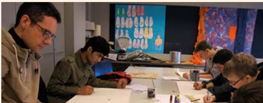
Verkstad för konstfostran i den finska högstadieskolan i Östra centrum. Studerandena avlade studieperioderna för inlärnin g i arbetet på arbetsplatser med anknytning till deras egna yrken.

Enligt NTM-centralens uppföljningsinformation hade utbildningen bättre sysselsättningseffekter än genomsnittet. Sex månader efter att utbildningen slutfördes var åtta av de 22 studerandena anställda, två i arbetsprövning och två i utbildning. De återstående tio utexaminerade var arbetslösa vid uppföljningstidpunkten.