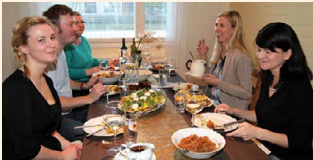
Riksdagsledamot Outi Alanko-Kahiluoto (till höger) på middag hos en estnisk familj.

Såväl deltagarna som värdfamiljerna och de organiserande föreningarna ansåg att dialogevenemangen var ett intressant och nödvändigt sätt att främja goda relationer. Den informella och fria atmosfären hjälpte deltagarna att bilda en mer mångfasetterad bild av minoritetsgrupperna, som i offentligheten presenteras som rätt enhetliga. Fördomarna minskade på båda sidor. Finlands Flyktinghjälp har fortsatt att ordna träffar som en del av sin frivilligverksamhet.