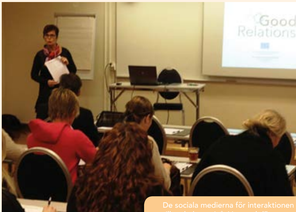
Dialogseminarium i Jokkmokk

De sociala medierna för interaktionen till en helt ny nivå. Var med där även kommunens invånare finns!