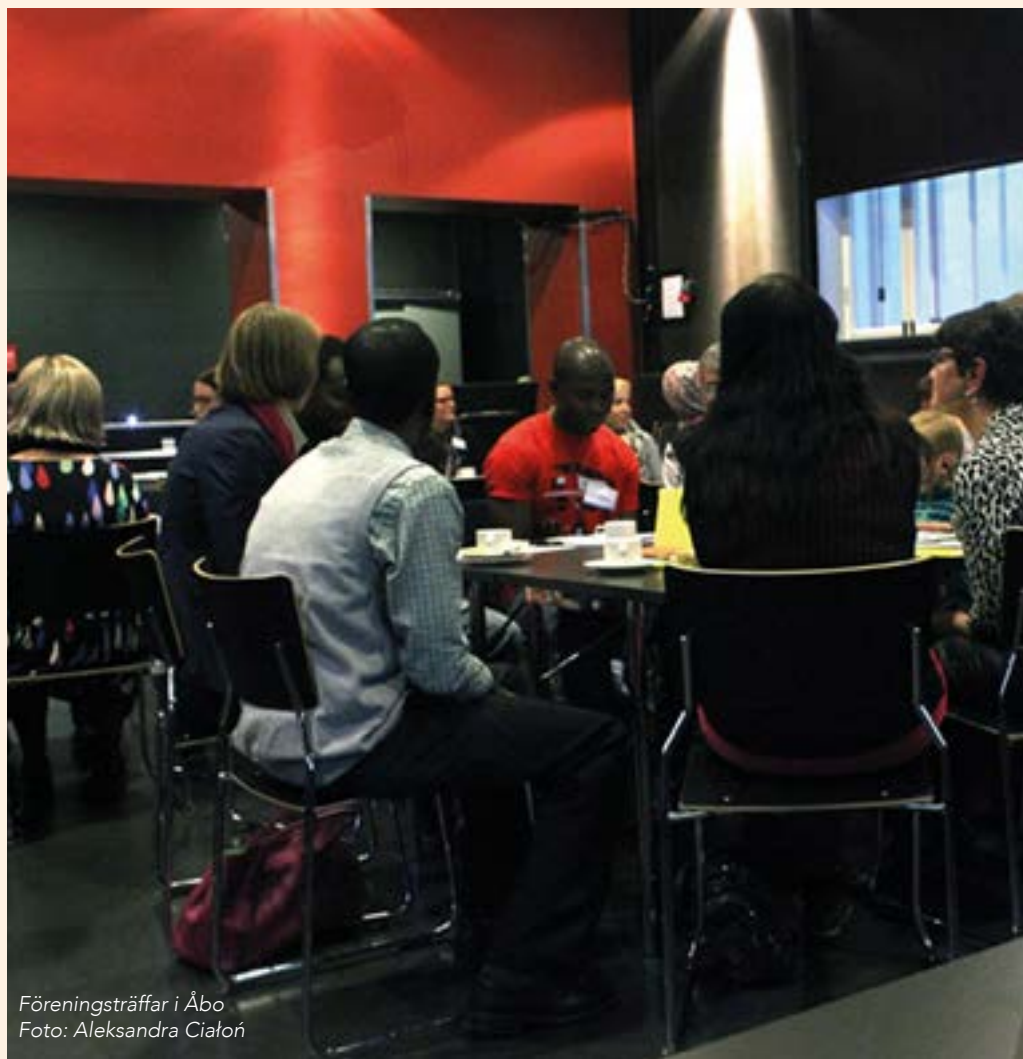
Föreningsträffar i Åbo