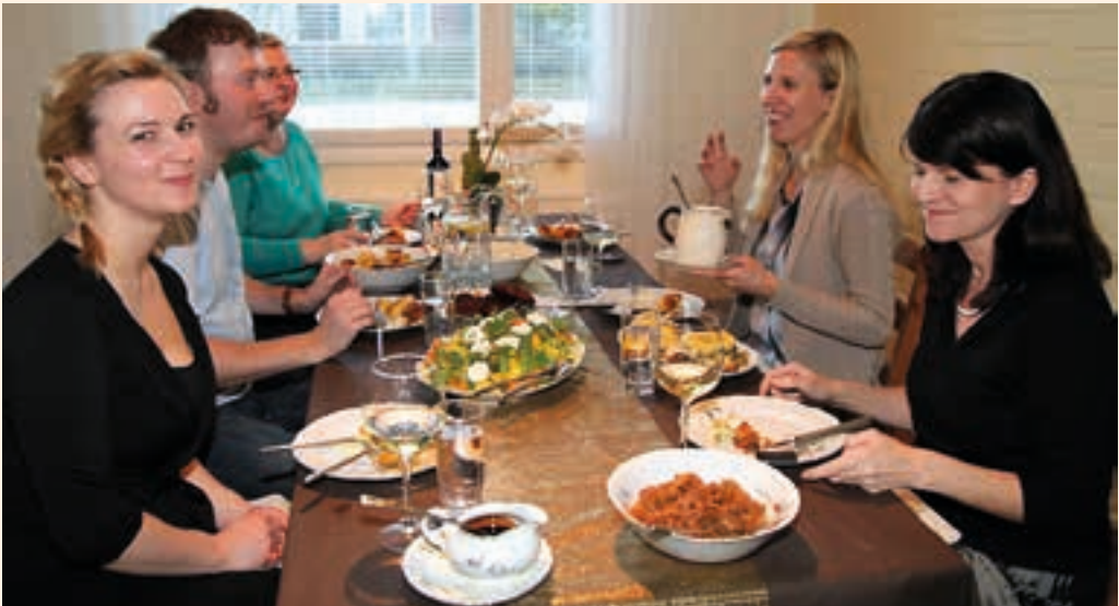
Kansanedustaja Outi Alanko-Kahiluoto (oikealla) päivällisellä virolaisperheen luona

Niin osallistujat, isäntäperheet, kuin järjestävät yhdistyksetkin pitivät tiedostamistilaisuuksia kiinnostavana ja tarpeellisena tapana edistää hyviä suhteita. Rento ja vapautunut ilmapiiri auttoi osallistujia muodostamaan monimuotoisemman kuvan julkisuudessa varsin yhtenäisinä esitetyistä vähemmistöryhmistä. Ennakkoluulot karisivat puolin ja toisin. Suomen Pakolaisapu on jatkanut kohtaamisten järjestämistä osana vapaaehtoistoimintaansa.