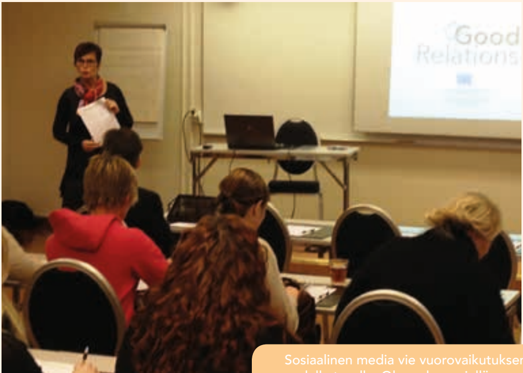
Tiedostamistilaisuus Jokkmokkin kunnassa

Sosiaalinen media vie vuorovaikutuksen uudelle tasolle. Ole mukana siellä, missä kuntalaisetkin ovat!