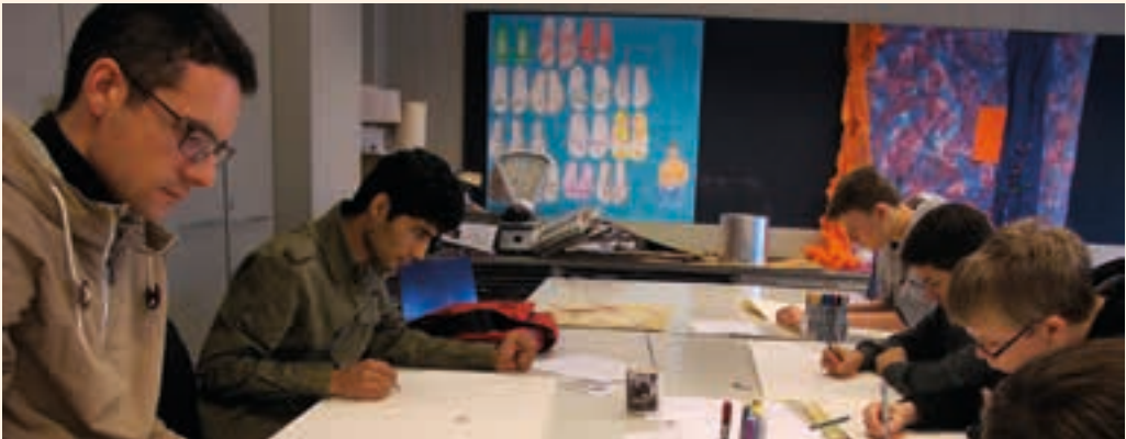
Taidekasvatustyöpaja Itäkeskuksen yläasteella. Opiskelijat suorittivat työssäoppimisjaksot omiin ammatteihinsa liittyvillä työpaikoilla.

Koulutuksen työllistämisaikutukset olivat ELY-keskuksen seurantatietojen mukaan keskimääräistä paremmat. Kuusi kuukautta koulutuksen päättymisen jälkeen valmistuneista 22 opiskelijasta työssä oli kahdeksan, työkokeilussa kaksi ja koulutuksessa kaksi. Loput kymmenen valmistunutta olivat seurantahetkellä työttöminä.