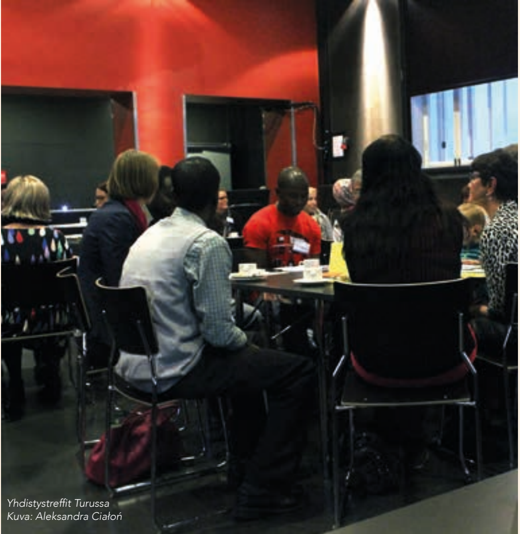
Yhdistystreffit Turussa